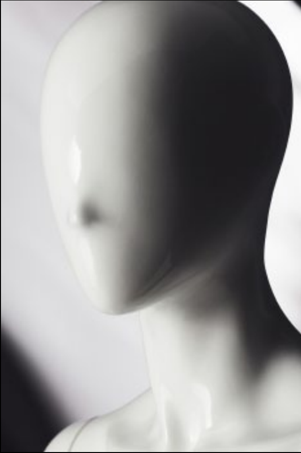
Head: J 248