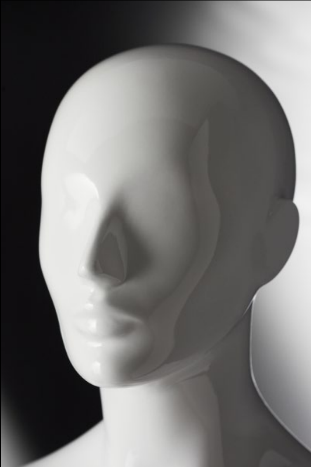
Head: J 269