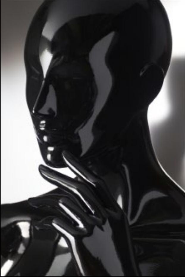
Head: J 269