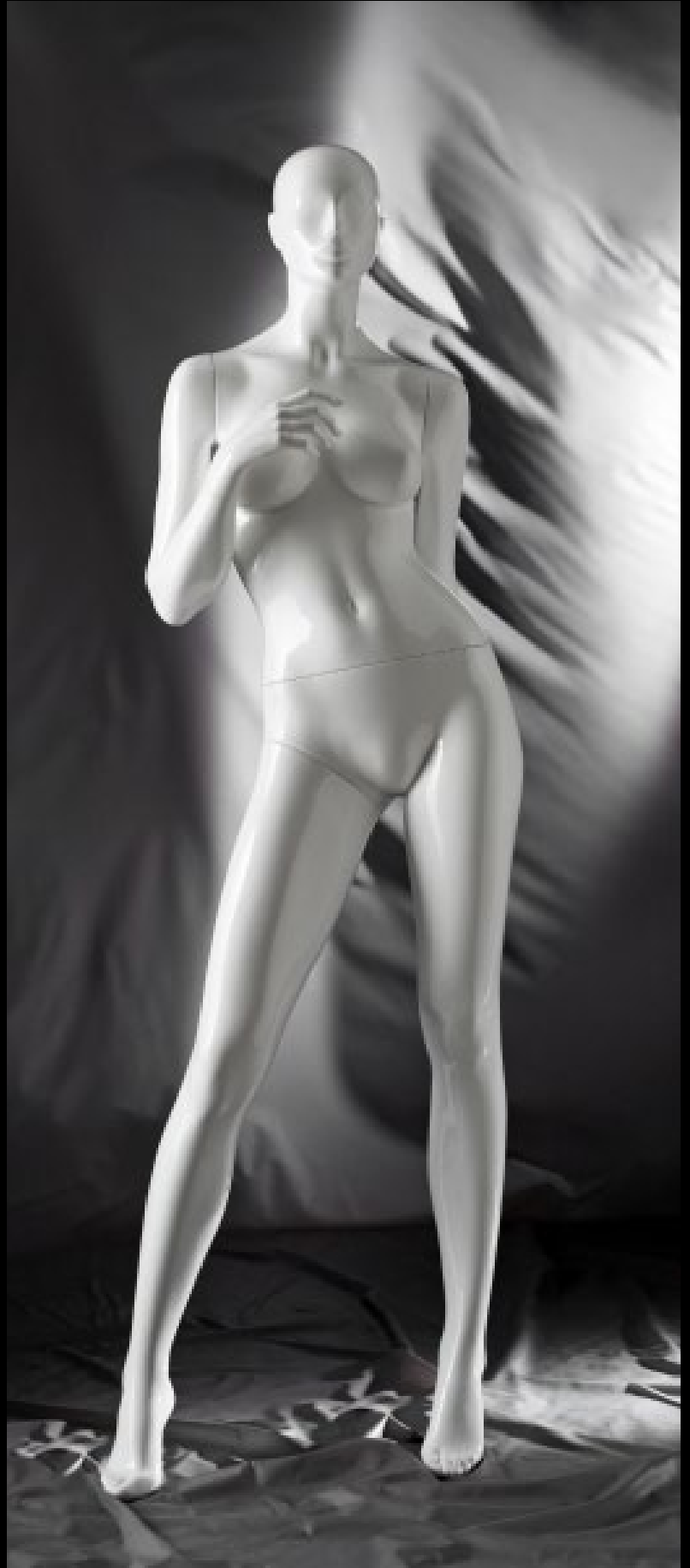
Body Col.: 287 Glossy White