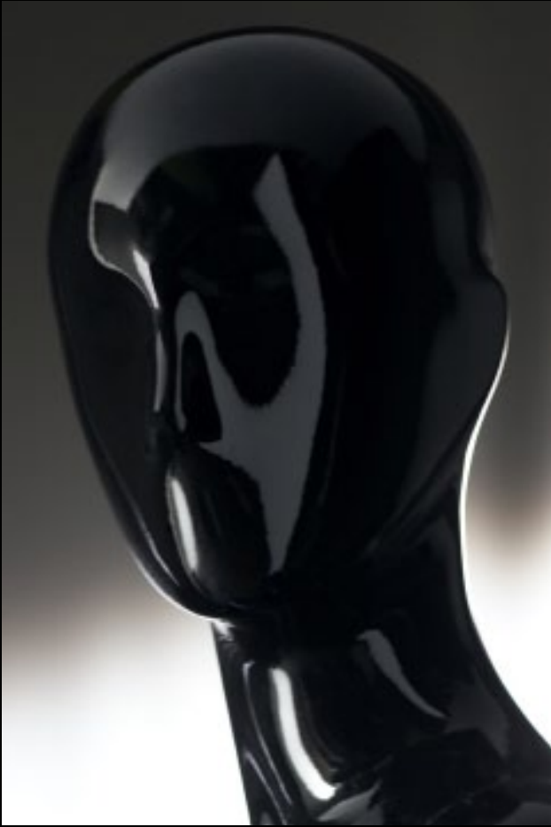
Head: J 266