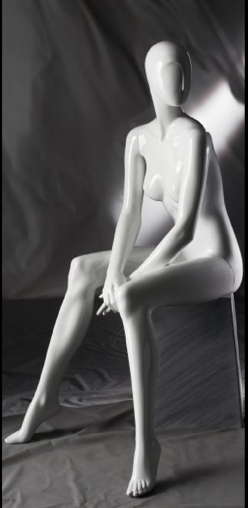
Body Col.: 287 Glossy White