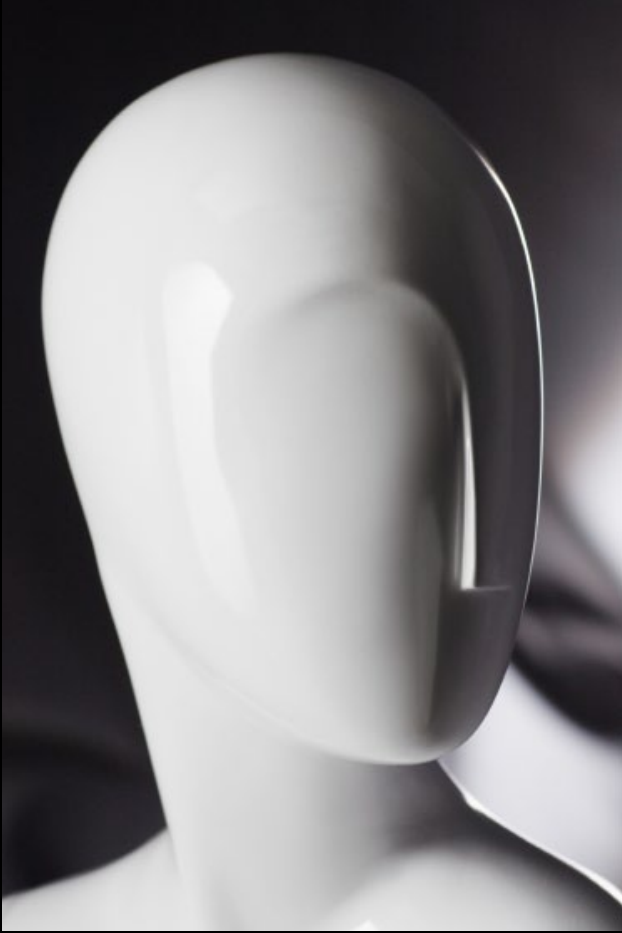
Head: J 268