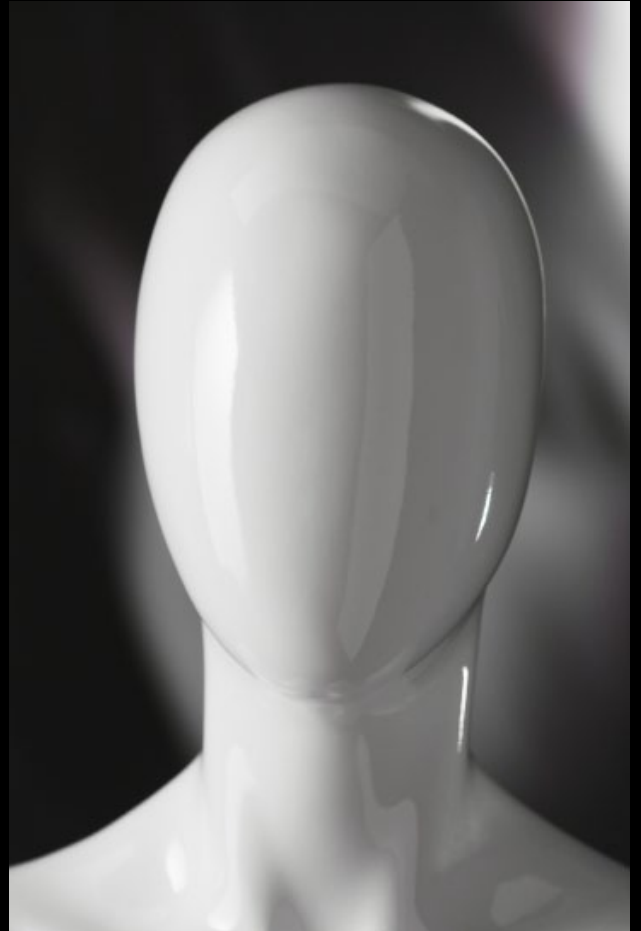
Head: J 250