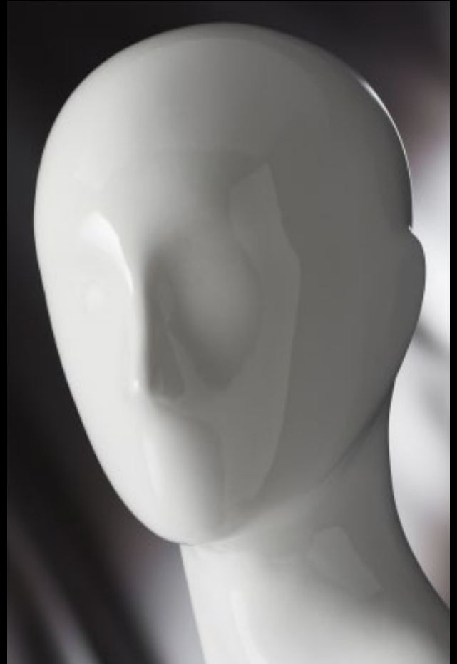
Head: J 266