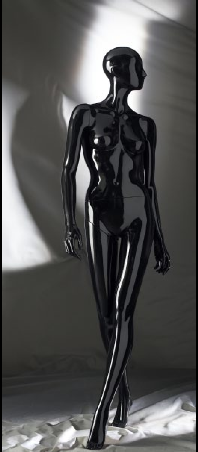
Body Col.: Glossy Black