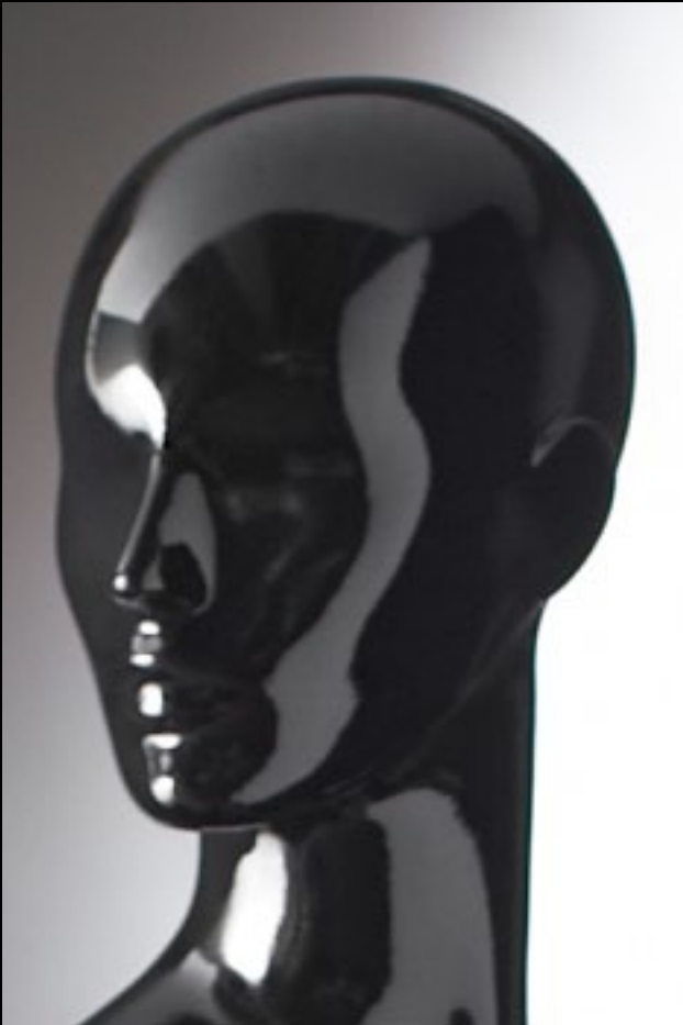
Head: J 269