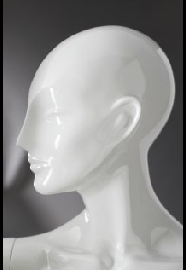
Head: J 271