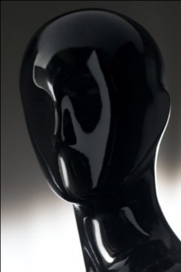
Head: J 266